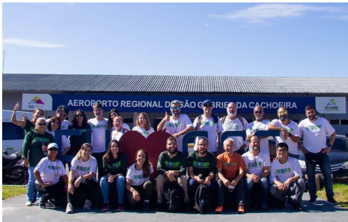
Parte da equipe EDS – 48ª Expedição de Saúde

A Associação Expedicionários da Saúde (EDS) tem a satisfação em informar os resultados da 48ª Expedição de Saúde realizada entre os dias 11 e 18 de junho de 2022, em Pari-Cachoeira, na Terra Indígena Alto Rio Negro-AM, que atendeu indígenas das etnias Baré, Desana, Dow, Hupda, Kubeo, Piratapuya, Siriano, Tariana, Tukano e Tuyuca e Yuhupdeh.